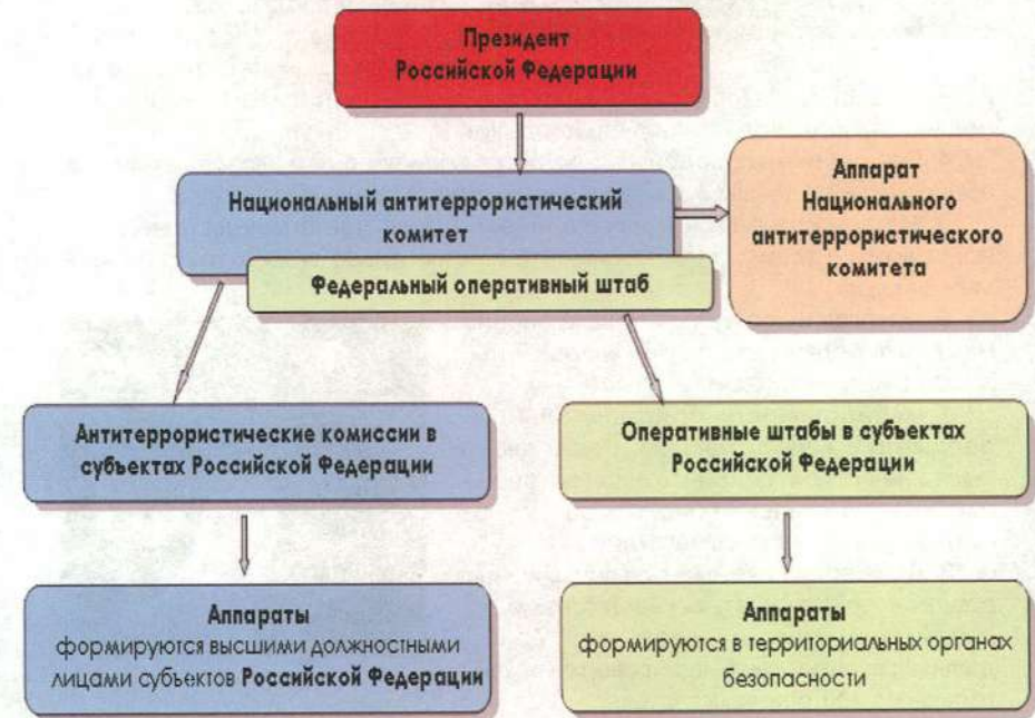
Схема координации деятельности по противодействию терроризму в Российской Федерации