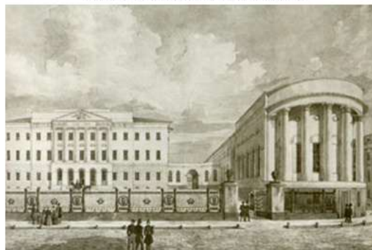
Московский университет и Татъянинская домовая церковь в 1848г.