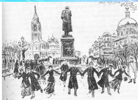
Студенческое гулянье на Тверском бульваре